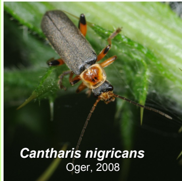
Cantharis nigricans Oger, 2008