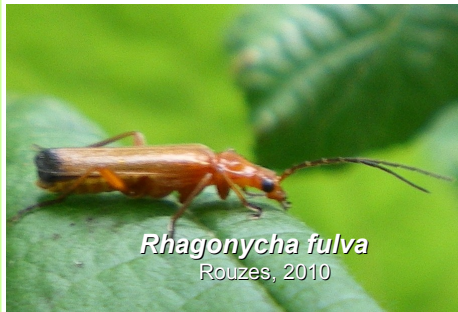
Rhagonycha fulva Rouzes, 2010