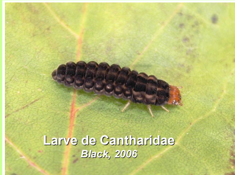
Larve de Cantharidae Black, 2006