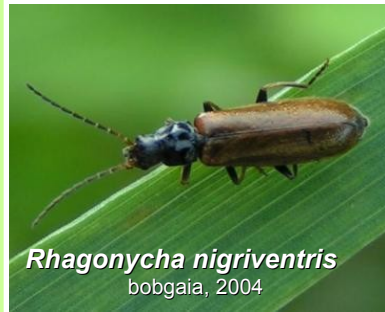
Rhagonycha nigriventris bobgaia, 2004